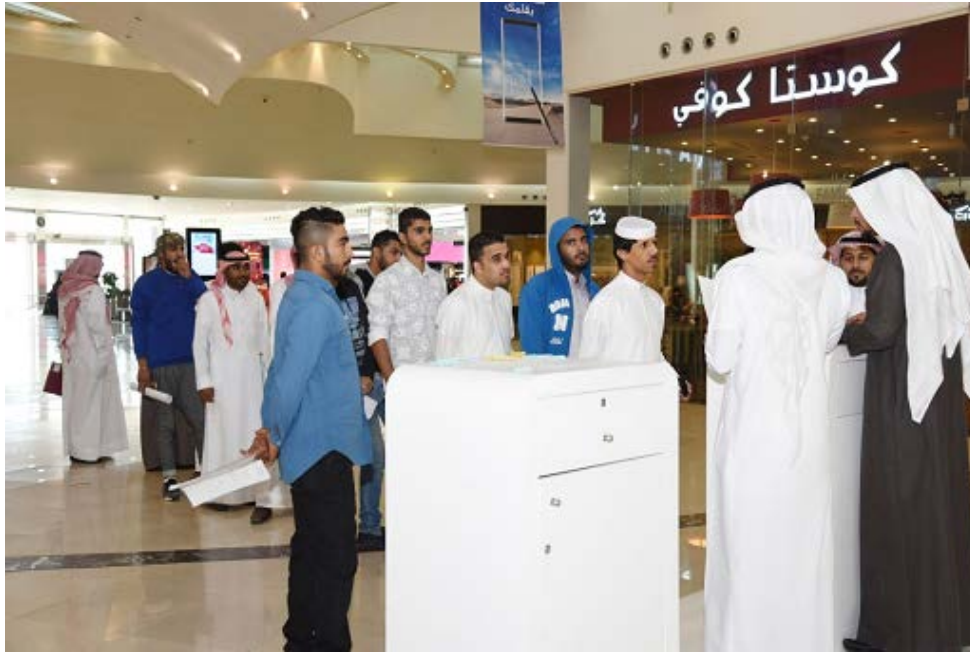
خلال حملة توطين المولات

ومن جهة أخرى فقد ساهم قرار توطين المراكز التجارية بشكل كبير على حملة توطين المولات التي أقيمت بالتعاون مع المراكز العربية وباب رزق جميل وساهمت بالمساعدة في توفير أكثر من 5500 شاغر وظيفي للشباب والفتيات على مستوى المناطق الرئيسية.